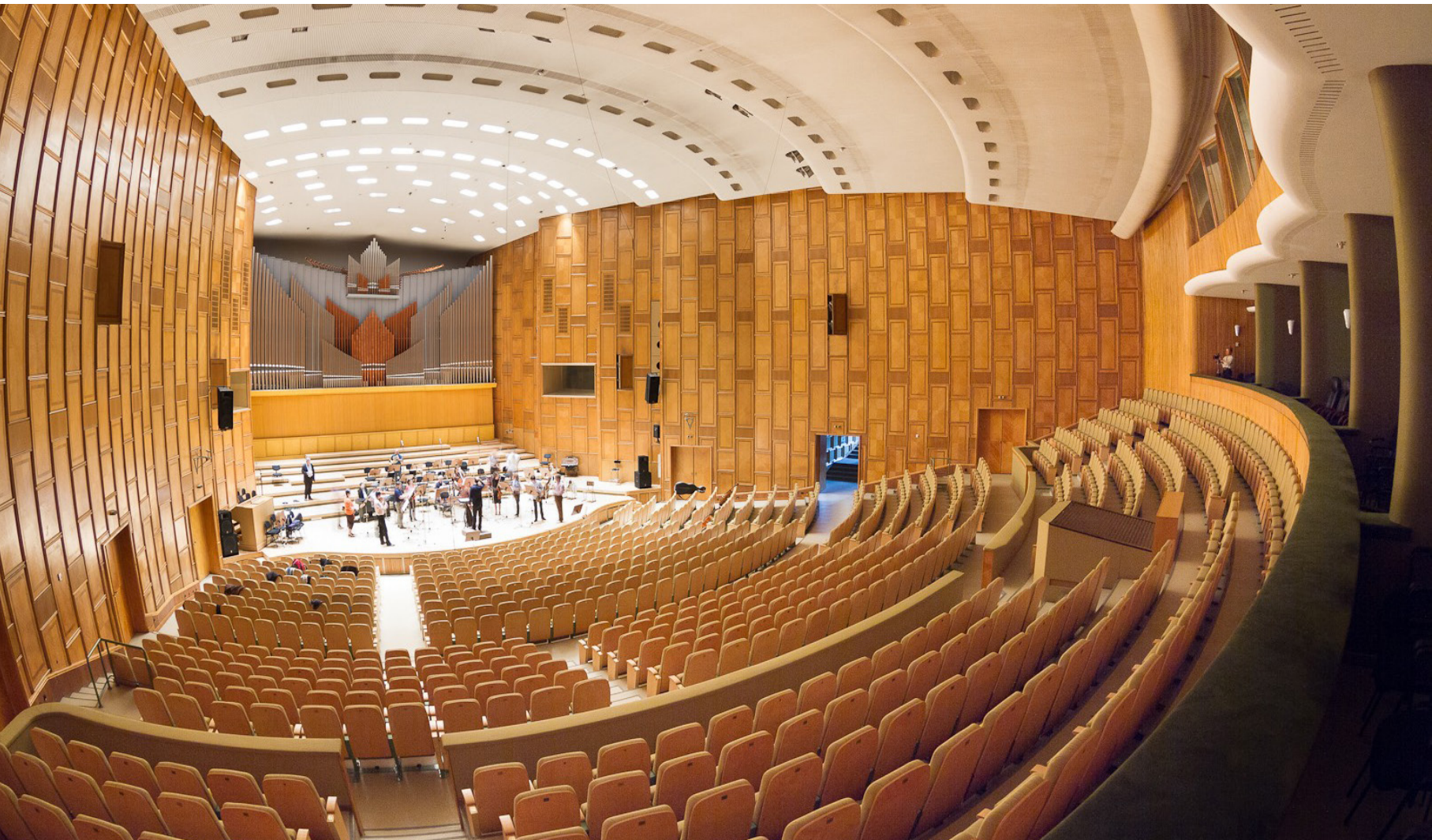
SALA DE CONCERTE MIHAIL JORA BUCAREST (RUMANIA) MOD. BRUSELAS AKAD