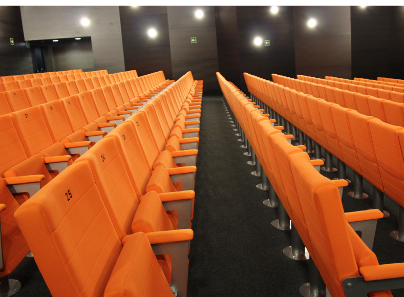
CENTRO CULTURAL IBAIONDO LAKUABIZKARRA VITORIA (ESPAÑA) MOD. FRANQUIN