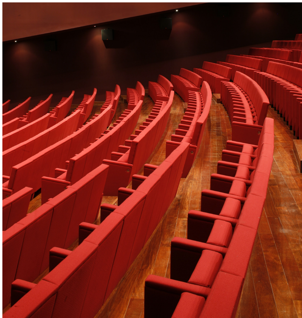
GRAN AUDITORIO TEATRO DAS FIGURAS FARO (PORTUGAL) MOD. CENFORSS