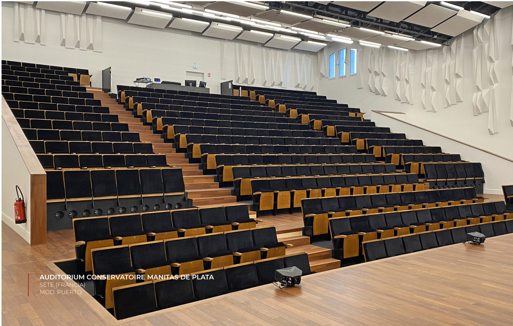
AUDITORIUM CONSERVATOIRE MANITAS DE PLATA SÈTE (FRANCIA) MOD. PUERTO